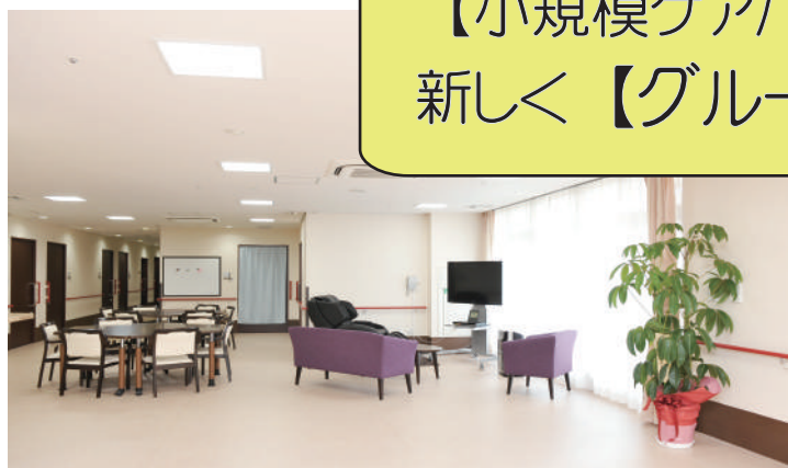
※写真はいずれもイメージです (大冠カーム小規模特養・ケアハウス)

◎現在提供中の【小規模多機能】【小規模特養】 【小規模ケアハウス】に加え、 新しく【グループホーム】が誕生します!