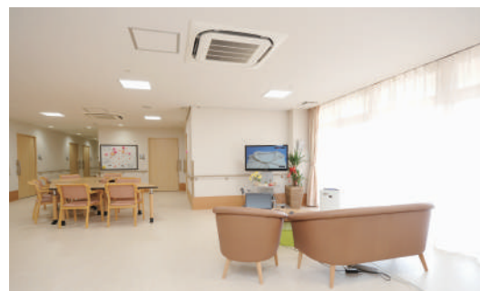
※写真はイメージです (大冠カーム小規模特養)